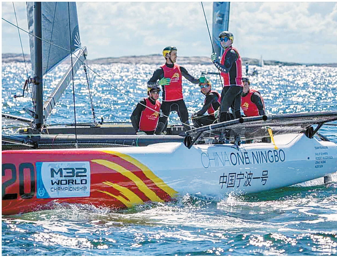
图为中国宁波一号帆船队在比赛中。