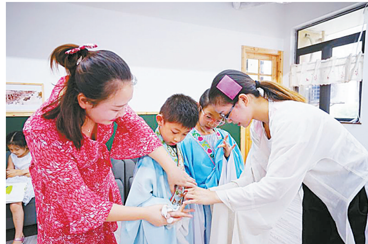
图为演员们手把手教孩子们“拗”造型。

本报讯(记者崔小明 通讯员房炜)“碧草青青花盛开,彩蝶双双久徘徊,千古传颂生生爱,山伯永恋祝英台”。昨天下午,海曙区望春街道清风社区童书馆里,不时地传出越剧《梁祝》唱段和孩子们开心的笑声,宁波市小百花越剧团暑期社区公益活动在这里举行。