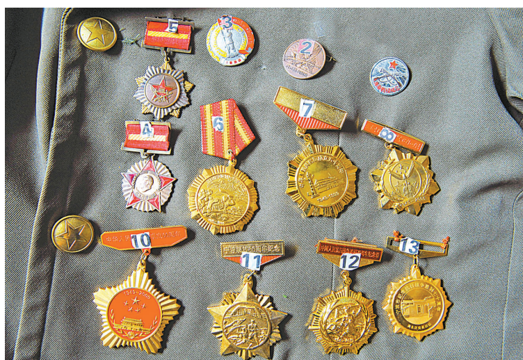
老人珍藏的部分勋章和抗日战争胜利纪念章。