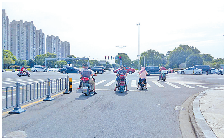
鄞县大道和河河南路路口没有遮阳棚,热不可耐的骑行人频闯红灯。

于构建宁波市中心城区户外广告长效管理机制的意见》(下文简称《意见》),《意见》规定:已经依附道路的遮阳棚、公交候车亭等九大类公共设施设置的广告设施,须在2017年底前终止设置行为。此外,2017年底前,任何单位不得另行新增附带广告设施的遮阳棚,否则,由各行业行政主管部门负责拆除。