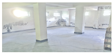
车库里的易燃物已全部清理。

上周,小e再次来到镇海区小骆花园,发现车库里干干净净,整齐停放着7辆非机动车。一位居民说,物业组织力量,逐幢对小区的车库进行了整治。现在,业主们都开始自律,不在车库堆放物品了。(廖业强)