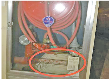
6楼消防栓箱内的水带终于归位。

网友爆料,江夏桥东金光中心凌江名庭今年4月30日曾经发生火灾,可好了伤疤忘了疼,消防巡查记录又开始缺失,消防栓里的水带也不见了。