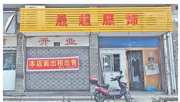
“服装加工厂”出租出售。