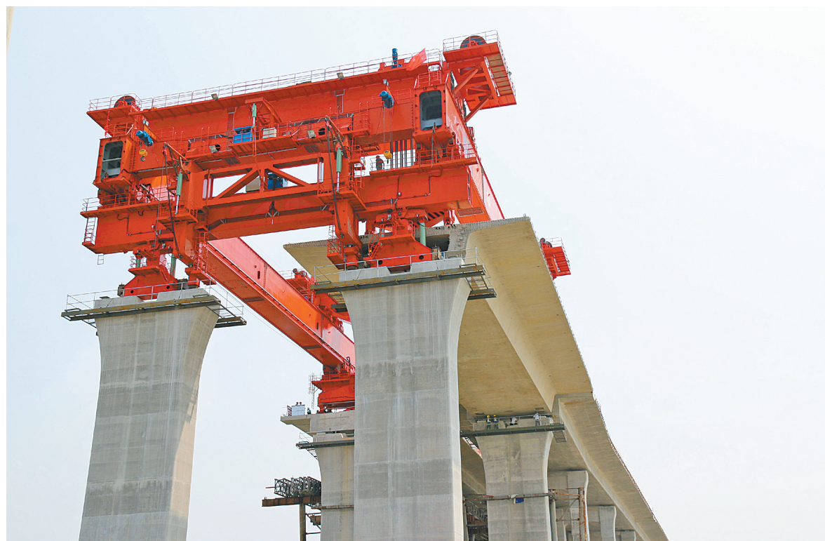
图为箱梁架设现场。

截至目前，三门湾大桥及接线工程项目累计完成投资64.33亿元，占计划总投资的63.90%。该项目将于2018年年底建成。