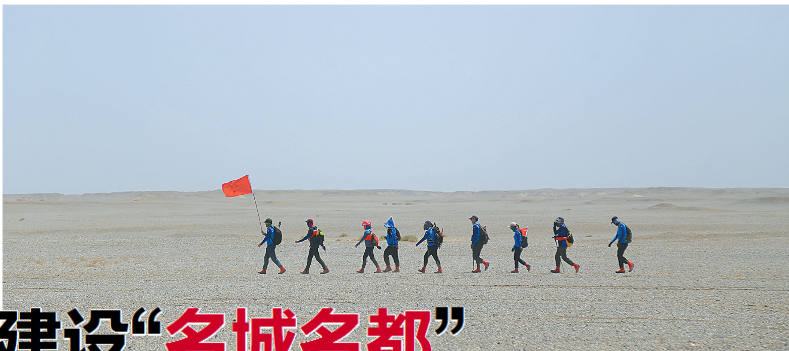
我市“创二代”企业家赴敦煌丝绸之路徒步穿越戈壁。

党外代表人士是与中国共产党团结合作、作出较大贡献、有一定社会影响的非中共人士，包括民主党派代表人士、无党派代表人士、少数民族代表人士、宗教界代表人士、非公有制经济代表人士、港澳台海外代表人士等。党外代表人士是党和国家人才队伍的重要组成部分，是推动中国特色社会主义事业发展的重要力量。培养使用党外代表人士，是党的一贯政策，是我国政治制度的安排。加强党外代表人士队伍建设，是我们党的统一战线的战略任务和基础工程。2012年2月，中共中央专门出台《关于加强新形势下党外代表人士队伍建设的意见》；2015年5月召开的中央统战工作会议和颁布的《中国共产党统一战线工作条例（试行）》，进一步明确了党外代表人士队伍建设的有关要求。