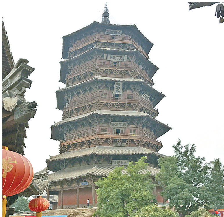
图为应县木塔全景。

我们随着景区工作人员参观了一层大殿。殿内供奉的10余米高的泥塑释迦牟尼像和内筒壁画皆为辽代原物。工作人员遗憾地告诉我