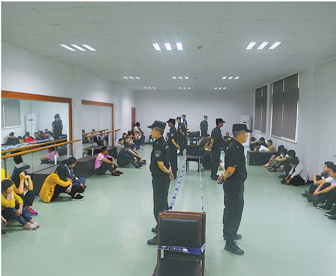
图为去年奉化警方破获“1040阳光工程”传销案时的情景。

有民警说，打击非法传销工作，任重道远，要做好打持久战的心理准备。同时，打击传销也是一项社会系统工程，需要长期行之有效的综合治理和调动全社会的力量共同参与。