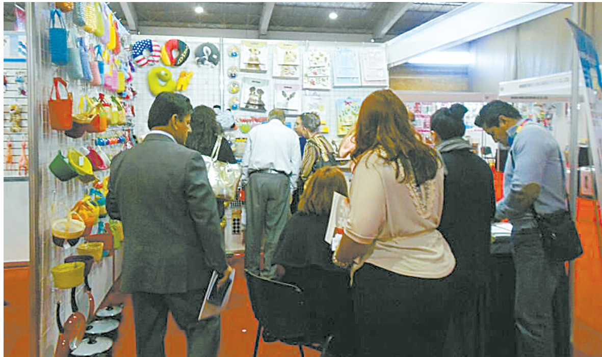
上一届交易会上，客商络绎不绝。

由于墨西哥国内生产文具、办公用品技术薄弱，加之中国制造的文具、办公、礼品、家居用品价廉物美，墨西哥人一向青睐“中国制