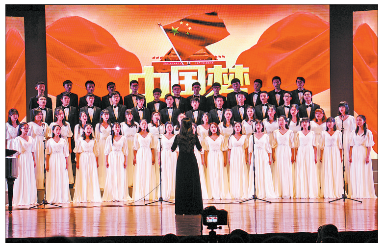
浙大宁波理工学院举办“唱响青春求是梦，喜迎党的十九大”大学生主题合唱汇演。（资料图）

一是课程实践学分化。规定每门课程实践学分和学时，强化对课程的实践教学考核，实现了全部课程的实践环节设计和执行。二是专业实践体系化。建构专业能力矩阵，实现专业实践与能力矩阵相对应，强化能力训练。三是产业实践