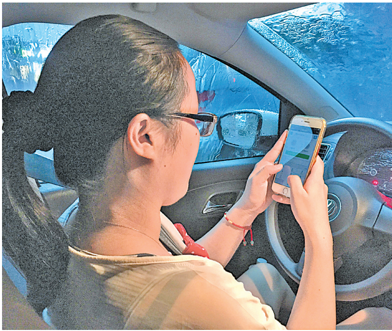
昨日突降暴雨，市民周女士在车内便完成了咪表停车费用的支付。

不仅如此，车主可通过“车位查询”功能，掌握目的地咪表泊位的使用情况，提前规划停车地点。