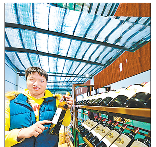
在位于福州出口加工区的进口商品展示直销中心，入驻商家的营业员在介绍来自法国的干红葡萄酒。