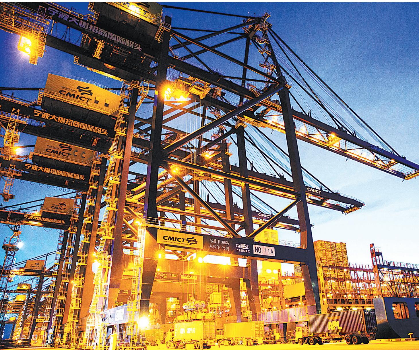
大榭招商国际码头繁忙作业场景。

在经济新常态下，服务贸易已经成为我国转变经济发展方式的重要引擎。尤其在数字技术和数字经济驱动下，制造业服务化和服务业国际化趋势更加明显，推动全球服务贸易加速发展。当前，服务业占世界经济总量比重达70%，服务贸易占世界贸易的比重已接近四分之一并将继续稳步上升。加快发展服务贸易，是宁波融入和服务国家战略，加快推进新一轮对外开放，加快转变经济发展方式的重要着力点。