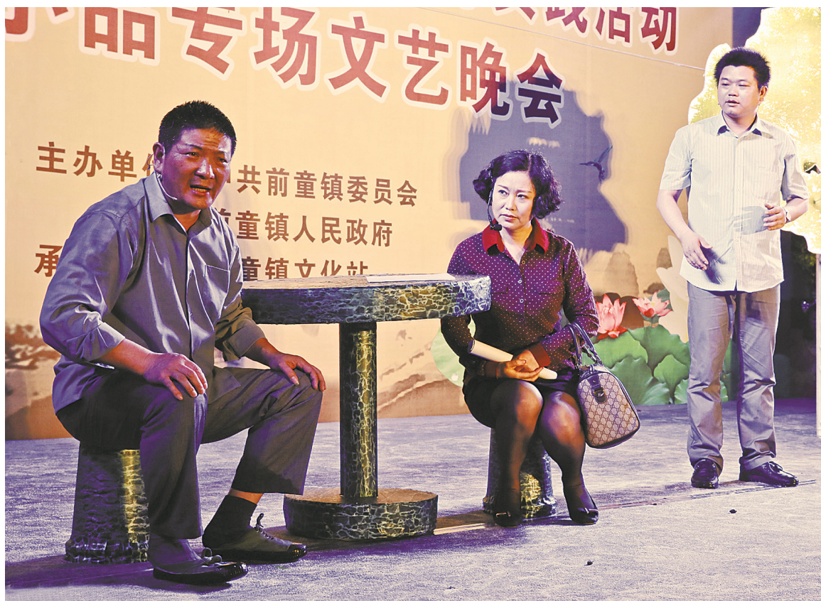
“百姓大舞台”上演的小品节目非常接地气。

“百姓大舞台，有才你就来。”截至目前，宁海全县已举办“百姓大舞台”活动230余场次，覆盖三分之二的建制村，受惠群众12万余人次。百姓舞台百姓演，真正实现了群众文化共建共享。