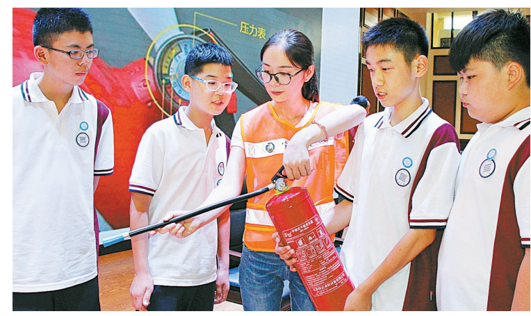
昨天, 宁波市公共交通集团联合公交服务稽查大队为镇海尚志中学200多名师生带来了文明交通安全宣传教育的“开学第一课”。