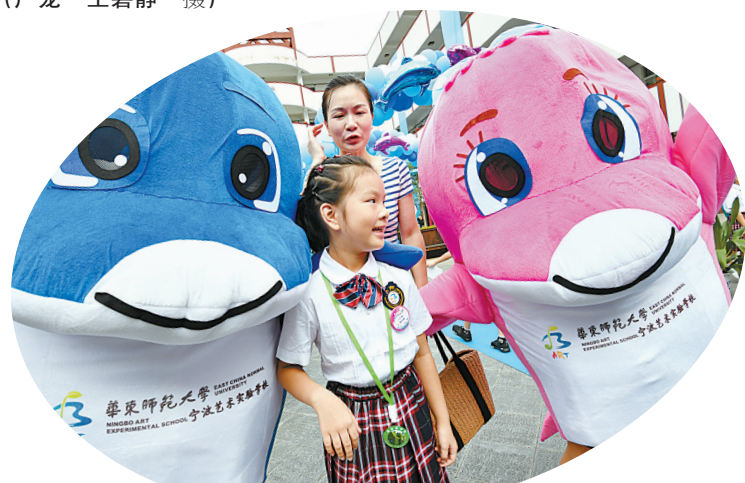
昨天上午, 华师大宁波艺术实验学校一名新生正与校园的一对吉祥物——“丫丫”“乐乐”海豚合影。