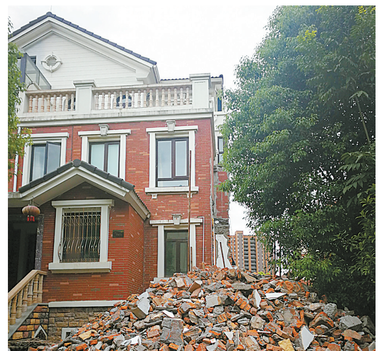
图为业主在房屋一侧的绿地上搭建了一至三层的违法建筑, 目前已被强制拆除。

至今, 根据分类处置政策, 相关职能部门已对符合罚没条件的216户作出没收违法收入的决定, 收缴罚没款1780余万元; 另有114户住户选择自行整改; 对34户拒不整改的, 已启动强制执行程序, 其中9户违建已拆除完毕, 9户正在拆除中, 剩余的将力争在今年年底前拆除。