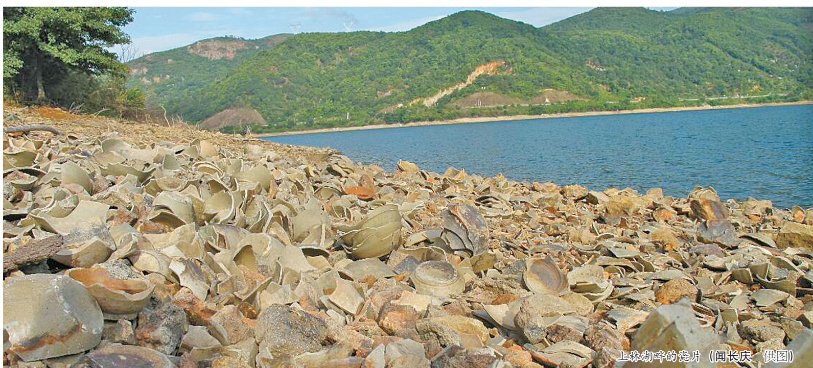
上林湖畔的瓷片

年间，浙江省文物考古研究所等单位对上林湖中部的后司岙窑址进行考古发掘，有了重要发现。后司岙发现大量的残器或瓷片，基本可以对应法门寺地宫和其他窑址出土的秘色瓷，有些几乎是相差无几。如此高度的一致，足以证明后司岙窑址是秘色瓷的重要产地之一。这一发现，得到了考古界的高度认可，后司岙窑址被评为2016年全国十大考古新发现。