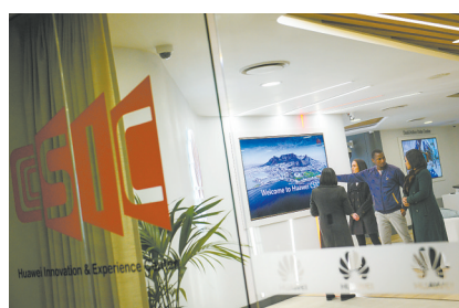
华为在南非的信息通信技术创新体验中心。

据悉，自2007年11月承办首期“发展中国家港口管理官员研修班”起，宁职院已承办多期“港口班”、“职教班”和“汽车班”，惠及亚非拉等众多发展中国家的学员。