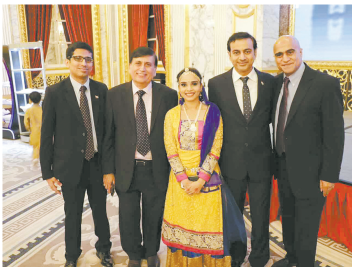
图为Krishna在印度驻华大使馆。