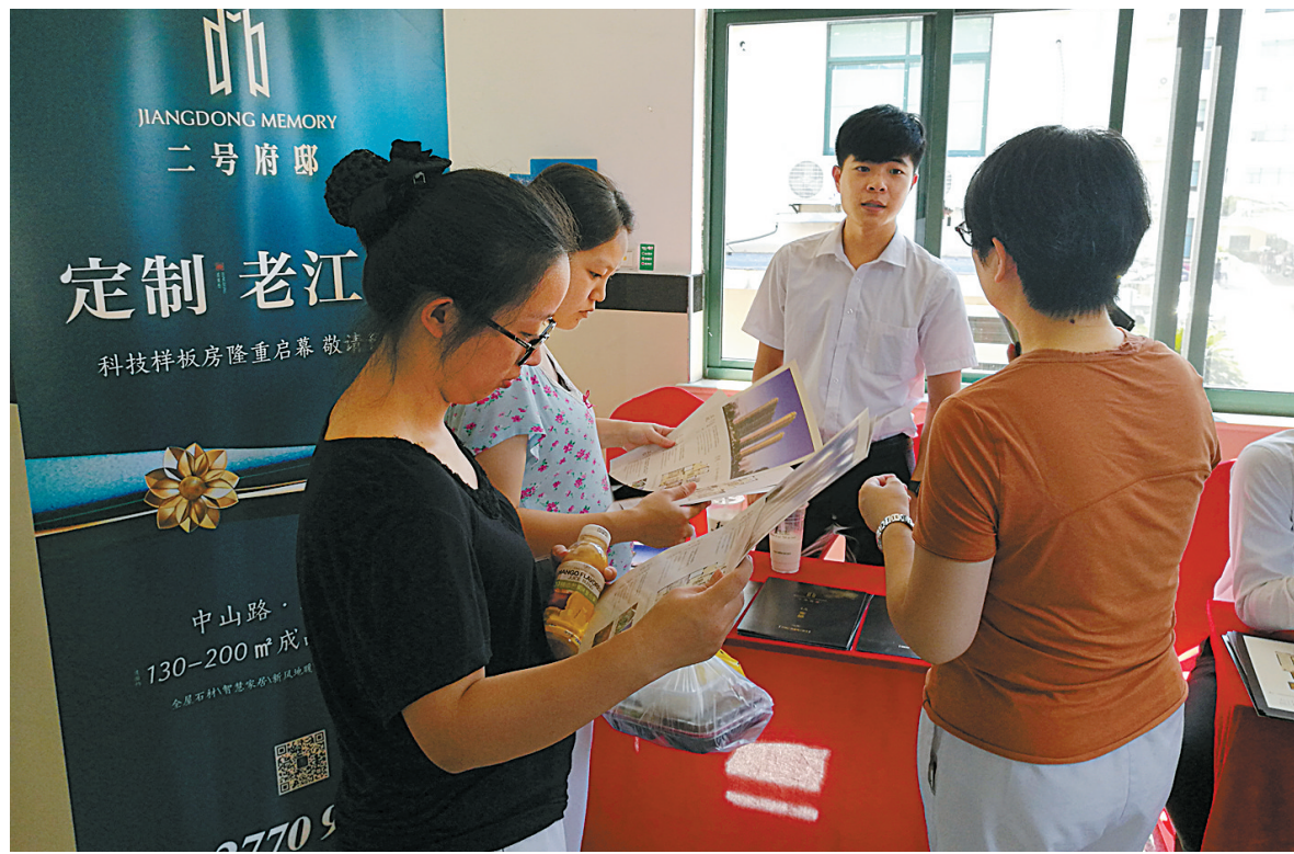
房企销售人员在鄞州人民医院职工餐厅展示并介绍楼盘概况。

活动中，二号府邸推出存5万抵10万优惠活动，让购房者享受实实在在的实惠。当一部分咨询者获悉二号府邸约138平方米样板间目前已开放，他们纷纷要求实地参观，一睹供销社发力的第一个精装豪宅。在样板房内，其内部采用国际一线品牌全系统精装、奢华品质工