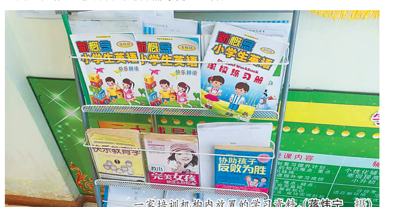
一家培训机构内放置的学习资料。

教育部门提醒各位读者和家长朋友，在选择培训学校时，请查看该校是否有由教育部门审批颁发的《中华人民共和国民办教育办学许可证》，在缴费后及时索取正规发票并妥善保管，同时与培训学校签订培训合同。