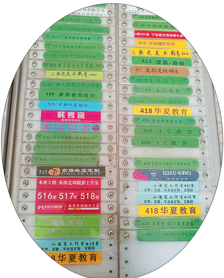
一幢写字楼里密密麻麻的培训机构指示牌。