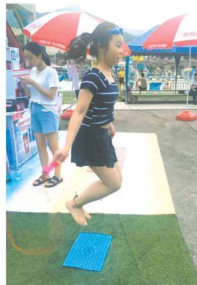
小朋友在趾压板跳绳。