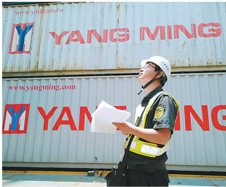
理货员在码头进行人工理货。

以梅山港区为例,实施智能理货后,1名智能理货员能承担原先由3人至4人才能完成的工作任务,人力资源精简50%以上。截至今年9月底,该智能理货项目的设备设施已覆盖宁波舟山港主要集装箱码头的80余台桥吊。据估计,宁波舟山港全港实施智能理货后,每年可节省1700万元的人工成本。