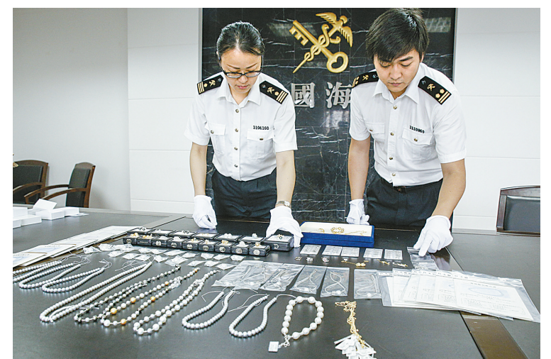
近日,一批价值超过15.4万元的珍珠制品在宁波栎社国际机场旅检渠道被海关人员截获,其中包括珍珠项链、珍珠耳环、珍珠耳钉、珍珠戒指等86件制品。由于境内外珍珠差价大、利润高,不法分子往往通过行李夹藏、人身夹带等方式走私出境。

同时,在公募FOF尚未有丰富的历史业绩作为参考的情况下,投资者仍需要关注普通基金产品的历史业绩和基金公司的规模。李松林说,因为业绩好的基金产品,通常是做对了投资决策,且对投资标的和投资策略进行了深入的研究。(据新华社)