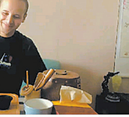
阿道说，他来到宁波，是因为这里给了他一种归属感。

阿道说，他来到宁波，是因为这里给了他一种归属感。在宁波，他感受到了来自陌生人的善意和热情。他在这里找到了志同道合的伙伴，共同创业、共同成长。宁波这座城市，让他看到了无限的可能和机遇。