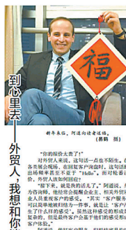
阿道说，他来到宁波，是因为这里给了他一种归属感。

阿道说，他来到宁波，是因为这里给了他一种归属感。在宁波，他感受到了来自陌生人的善意和热情。他在这里找到了志同道合的伙伴，共同创业、共同成长。宁波这座城市，让他看到了无限的可能和机遇。