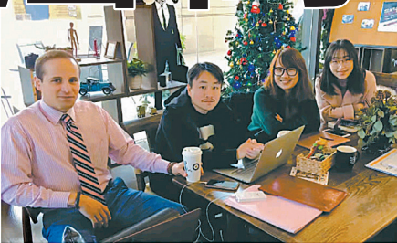
国际名校学霸、世界500强高管 摩洛哥小伙变身宁波创客