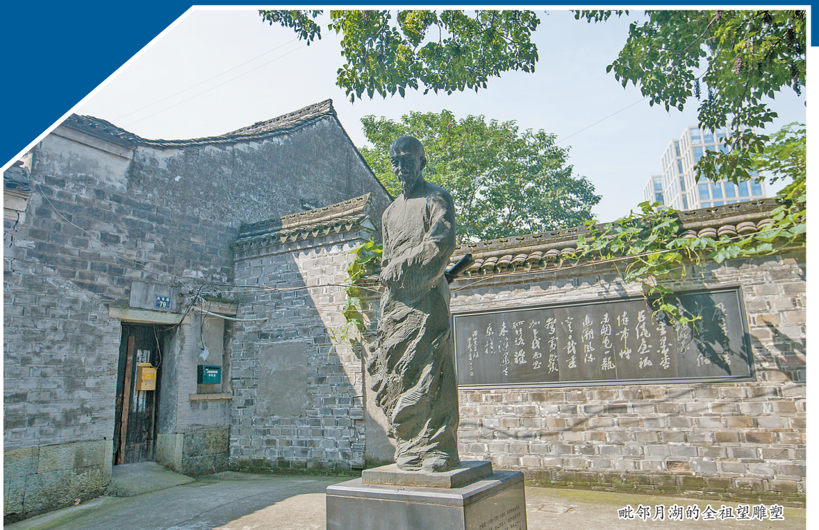
毗邻月湖的全祖望雕像