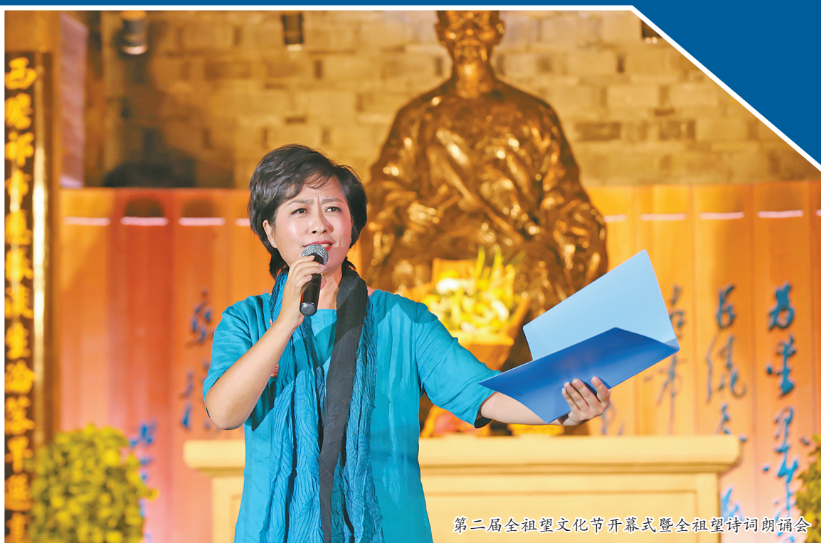
第二届全祖望文化节开幕式暨全祖望诗词朗诵会

“一缕青烟上碧霄，月里嫦娥鬓熏焦。天将差使来相问，十八太公烧瓦窑。”312年后的9月27日，海曙区举办第二届全祖望文化节，萦绕在洞桥镇沙港村暮色中的稚嫩童声拉开了活动的序幕，孩子们在文化节系列活动之“史学大柱全祖望诗会”上朗诵出全祖望童年脱口成诗的俏皮语句，再次勾起人们对先哲的无限敬仰之情。