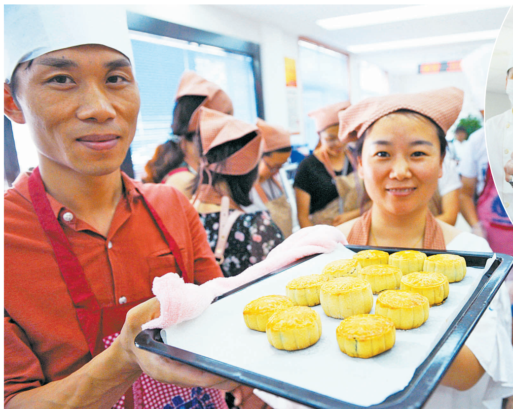
国庆节前夕,郑州福明街道陆嘉社区工会举行“叙乡情品中秋”活动,辖区外来务工人员人员和“老宁波”一起制作月饼,并把烤制好的月饼装进包装盒,连同充满深情的节日贺卡,让外来务工人员一同带回家。