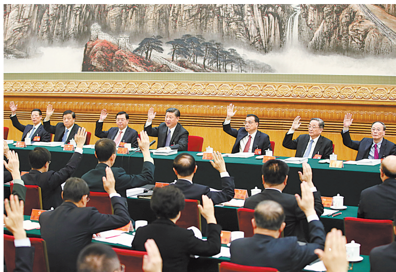
10月23日，习近平、李克强、张德江、俞正声、刘云山、王岐山、张高丽等出席主席团第四次会议。

据了解，从10月21日开始，各代表团对十八届中央政治局提出并经大会主席团通过的十九届中央委员会、候补委员和中央纪律检查委员会委员候选人预备人选名单进行了认真酝酿。代表们认为，这个名单是经过严密的组织程序、充分发扬党内民主产生的，集中了