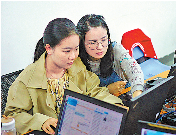
浙江纺织服装职业技术学院的“学生客服”。

要擦亮眼睛。国家发改委将于近期陆续披露6440家“双十一”电子商务黑名单企业，目前已公布首批500家电子商务黑名单企业。其中，宁波飞普、宁波索