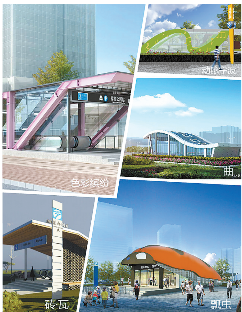
图为3号线出入口部分造型示意图。(张燕 制图)

环保、可持续的设计理念,对沿线特殊区域的个别站点出入口进行重点设计,突出个性和亮点。曲(标准站),该方案以“三江相汇五洲通,甬城千载毓灵秀”为设计主题,传承城市的地域特色与历史脉络,结合宁波历史上有重要意义的海上丝绸之路,体现现代交通建设的时代气息。瓢虫(特色站),该方案将出入口设计成一个昂首待发、展翅欲飞的七星瓢虫形状,寓意宁波轨道交通蓬勃向上的企业风貌。砖·瓦(特色站),该方案以江南水乡的砖墙黛瓦为蓝本,结合古代工匠屋顶瓦面的建筑构造技术,通过模仿瓦片勾连搭接的方式,形成连绵的屋顶形象,既象征城市砖瓦连绵不绝又似水波荡漾的大海,也意会现代宁波以海为生的水韵文化。 从即日起至11日24时,市民可关注“宁波轨道交通”官方微信投票,选出最中意的一套方案,投票结果将与专家评审意见一起,成为决定未来宁波轨道交通3号线出入口形象的重要参考。