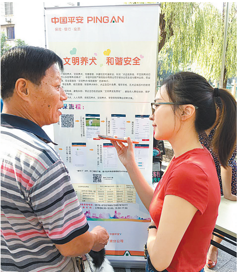
新推出的宠物保险受到市民关注。

值得一提的是，我市率先推出的公共食品安全责任险，城镇住房综合保险已实现全市覆盖。公共食品安全责任险目前累计提供风险保障47亿元，保费规模占全省一半以上。城镇住房综合保险为全市2.1万幢老旧房屋提供风险保障超千亿元。