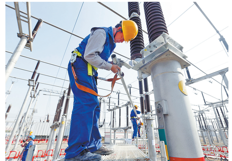
检修人员正在进行闸刀的地面组装。

本报讯(记者徐展新 通讯员王幕宾 陆晓依)11月15日,220千伏咸祥变2号主变及其三侧设备大型检修预试工作结束。100余名检修人员“奋战”6天,为冬季用电高峰的到来作准备,标志着宁波电网进入新一轮电网检修攻坚期。