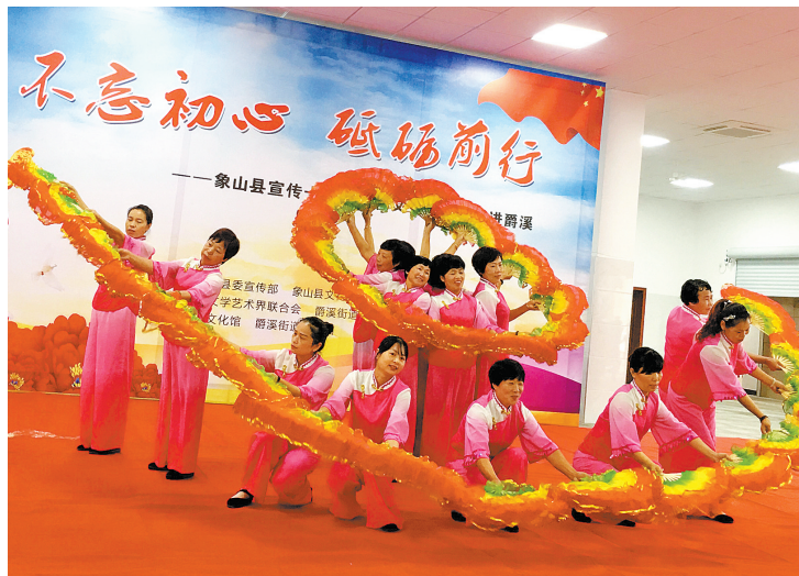
走书《认真学习十九大》、音乐快板《十九大精神放光芒》……近日,象山文艺小分队来到爵溪街道,用一个接地气的原创节目宣传党的十九大精神,博得当地村民如潮掌声。图为巡演现场。

据悉,11月和12月,宁波主电网将迎来技改检修的最高峰,涉及220千伏江南变、沙湾变等电站的技改检修项目,总数超过120项。