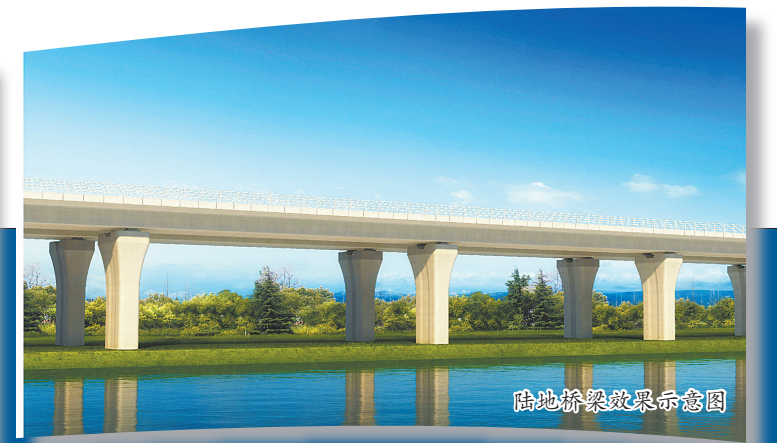
陆地桥梁效果示意图