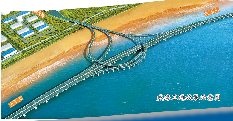
威海互通效果示意图