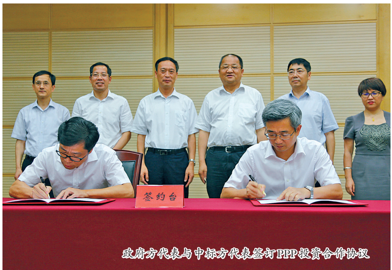
政府方代表与中标方代表签订PPP投资合作协议

领导小组，并明确市交通委为该项目实施机构。市交通委成立了PPP推进工作领导小组，下设PPP办公室。市交通委PPP领导小组会议专题研究20余次；与兄弟部门市发改委、市财政局等部门进行经常性沟通；对于PPP实施中两项关键内容——建管模式和绩效评价，特邀请部、省专家组进行评审；聘请律师对PPP有关文书进行法律审查；招标文件组织专家评审……在后续对每一项疑难政策的解读、应用以及推进过程中，我市不仅严格按照相关政策执行，而且多次向国家发改委、交通运输部等法规文件制定部门咨询相关问题的释义，为将本项目做成一个严格依法合规的PPP示范项目提供充分的法律法规依据。