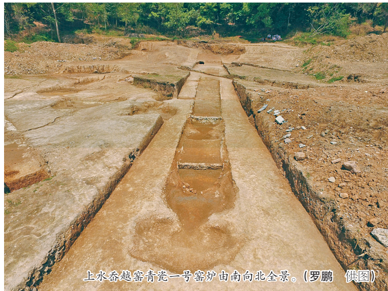
上水岙越窑青瓷一号窑炉由南向北全景。

可以这么说，在宁波各地发现的众多越窑青瓷窑址，说明了青瓷特别是越窑青瓷文化积淀之深厚，而宁波作为中国陶瓷“母亲瓷”的故乡更是名不虚传。