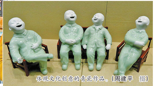
体现文化创意的青瓷作品。