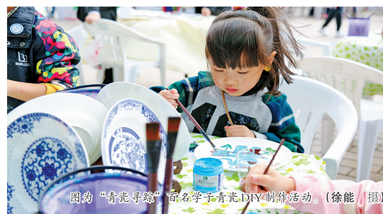
图为“青瓷寻踪”百名学子青瓷DIY制作活动。

越窑青瓷，作为宁波传统文化中最具特色的物质载体，与阳明思想一样具有远播海内外、影响世界的强大力量。那么在未来，青瓷文化能否成为宁波响应“一带一路”倡议、坚定文化自信、走向世界的又一张靓丽城市名片呢？让我们拭目以待。