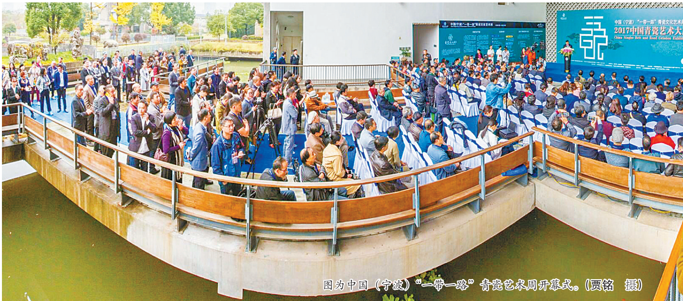
图为中国（宁波）“一带一路”青瓷艺术周开幕式。

青瓷，特别是越窑青瓷，作为宁波最具特色的传统文化代表之一，其弘扬传承和创新发展的破题，也由此成为大家关注的焦点。