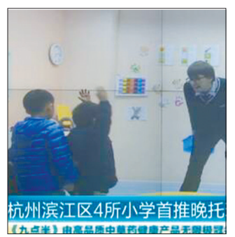
杭州滨江区4所小学首晚晚托

据11月27日《钱江晚报》报道：针对“孩子放学早，家长下班迟”的矛盾，近日，杭州滨江区闻涛小学、丹枫实验小学、滨和小学和东冠小学一年级至3年级试点实施免费课后服务。放学以后，申请免费课后服务的孩子将在老师的监护下，完成作业或参与文体活动。学校不向家长收取一分钱，所需费用全部由滨江区财政买单。