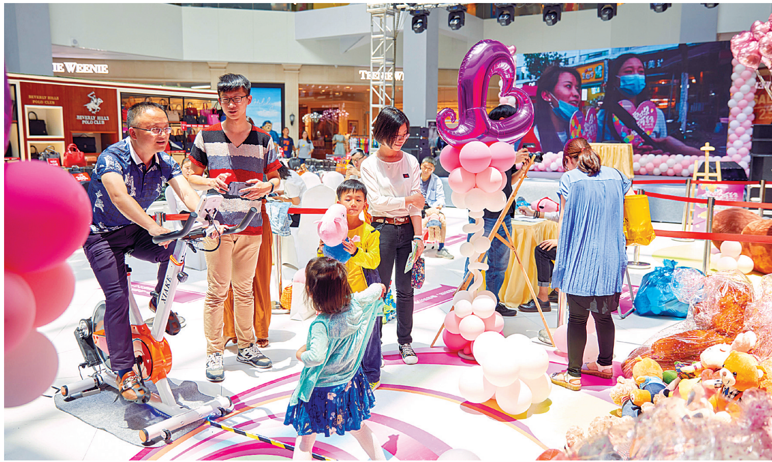
利时奥莱的社区属性日益增强。