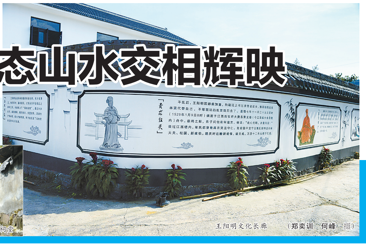
王阳明文化长廊

阴地龙潭村是明代著名哲学家、思想家、军事家、政治家、教育家王阳明的祖居地。王阳明的祖坟也在阴地龙潭村,当年他还来过村里祭祀祖先,并写下了祭文——《伯三公像赞》。此外,阴地龙潭村里还发现了王阳明祖上的家谱。为