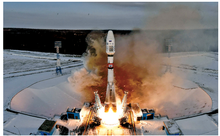
11月28日，在俄罗斯阿穆尔州，“联盟2.1B”运载火箭从东方航天发射场发射升空。据报道，这枚运载火箭未能将其搭载的一颗气象卫星送入预定轨道。