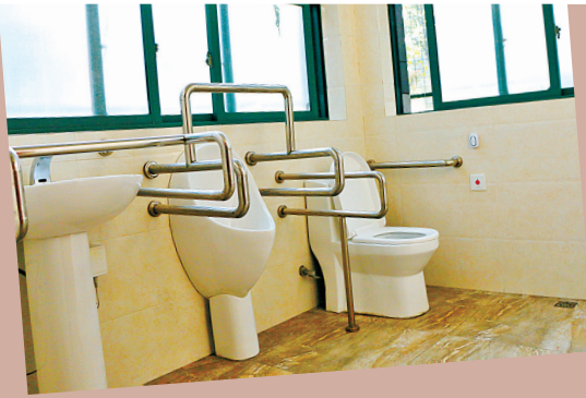
永丰北路公厕残疾人专用厕位。