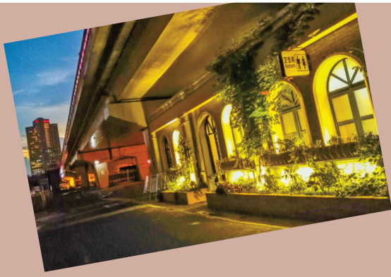
甬江大桥下的外滩公共厕所像个宫殿。