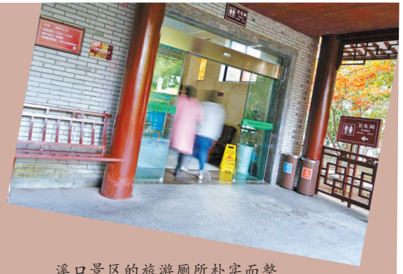
溪口景区的旅游厕所朴实而整洁。

昨日，各大媒体刊发了习近平就旅游系统推进“厕所革命”作出重要指示。强调旅游业是新兴产业，要像抓“厕所革命”一样，不断加强各类软硬件建设，推动旅游业大发展。