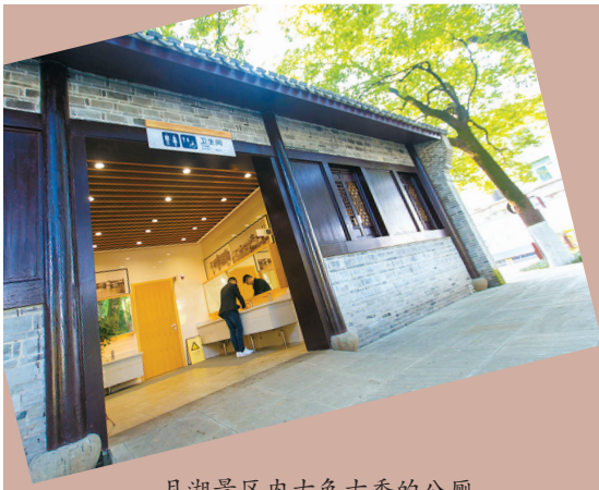
月湖景区内古色古香的公厕。