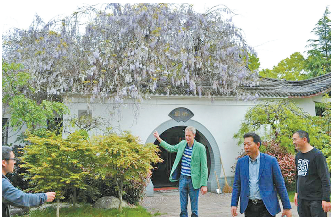
坐落在宁波梁祝文化园的公厕。