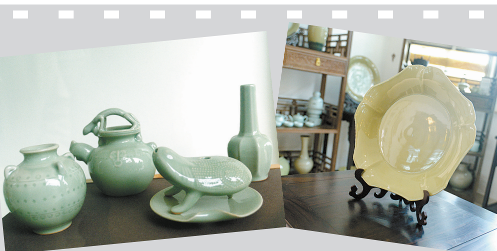
标价360元的越窑青瓷“四件套”。