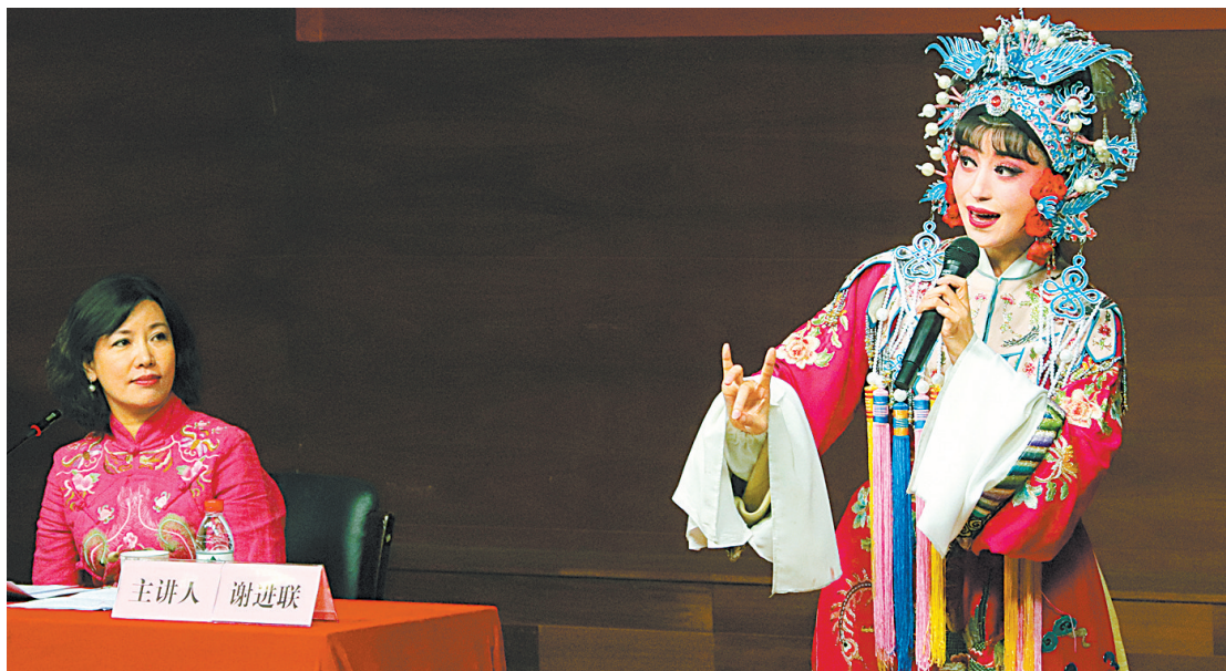
图为《越剧之美》越剧表演艺术专题讲座现场。

昨天下午,宁波大学西校区音乐学院小音乐厅里,一场别开生面的讲座在这里举行。国家一级演员、宁波小百花当家花旦谢进联给大学生们上了一堂生动的《越剧艺术赏析》课。谢进联或讲或唱,介绍了越剧的起源、发展历程和各个流派。她积极与大学生戏曲爱好者互动,每讲到一个流派,就请学生现场演唱,她随后进行讲解点评。