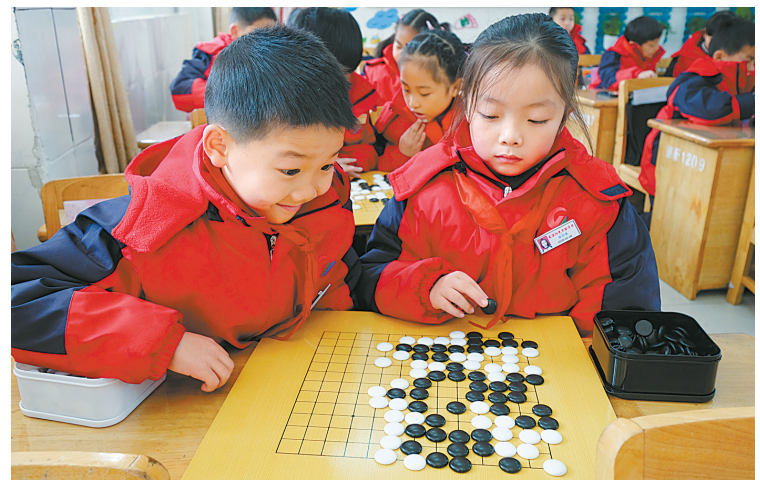
图为慈溪阳光实验学校的学生在教室下围棋。

本报讯(记者姬联锋 通讯员忻志华)宁波市学校围棋教学现场交流会暨慈溪阳光实验学校围棋拓展性课程展示活动昨天上午举行。来自市围棋传统学校、各国棋培训俱乐部等单位的近百人参加了这次活动。