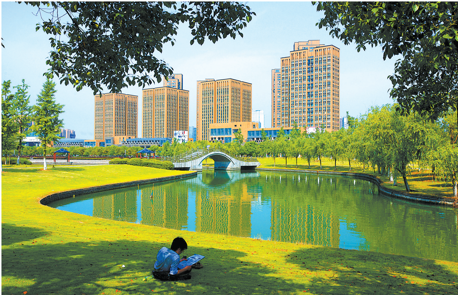
绿意浓浓的生活和工作环境是优质营商环境的重要组成部分。

对于宁波来说，打造优质营商环境，更是融入和服务国家战略，加快推进新一轮对外开放，