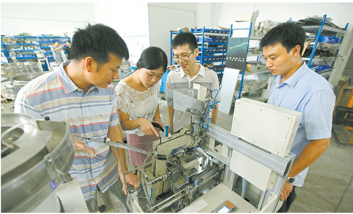
越来越多的创客集聚宁波。(资料照片)