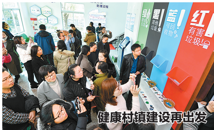
健康村镇建设再出发

理、内部流转、统一出件”原则,实现即办事项当场办结、待办事项一次办结、特殊事项只跑一次。同时,把信息整合到一个体系,国税、地税、工商等部门优化信息共享机制。该局还把多份材料整合成一份表单,推出了免填单和容缺服务,以及电子名片扫码免填单开票措施,最大程度减轻纳税人申报报送压力,实现了开票速度从几分钟到几秒钟的飞跃。