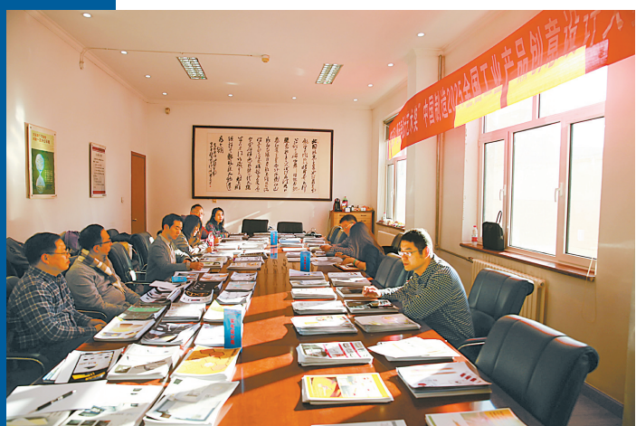
第五届“潘天寿设计艺术奖”中国制造2025全国工业产品创意设计大赛参赛作品颁奖现场。