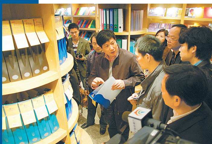
第三届“潘天寿设计艺术奖”文具设计人才对接企业，走访宁波鼎华实业有限公司产品陈列厅。