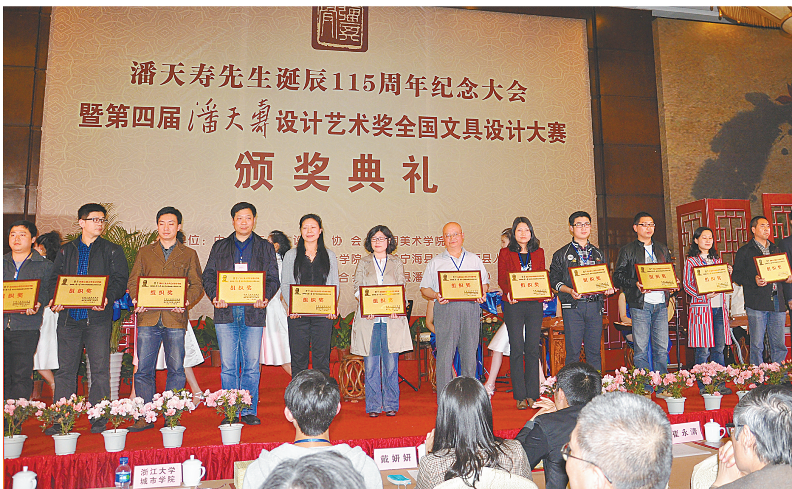
第四届“潘天寿设计艺术奖”全国文具设计大赛颁奖典礼现场。