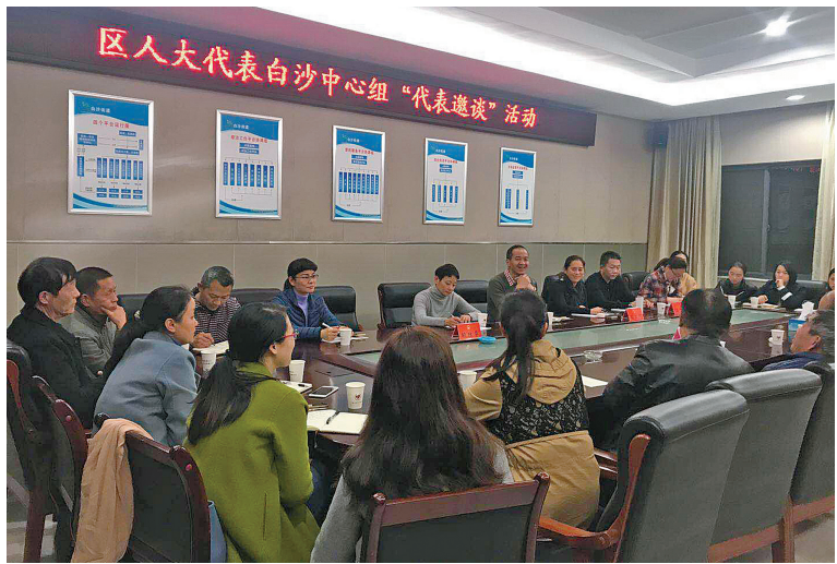
白沙人大代表夜聊倾听民声。