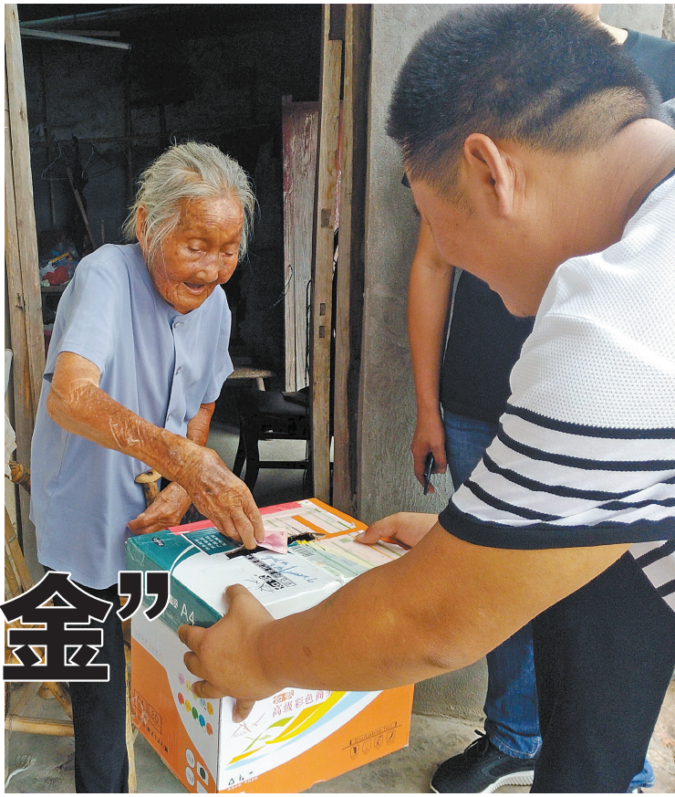
花吞岛百岁老人捐款