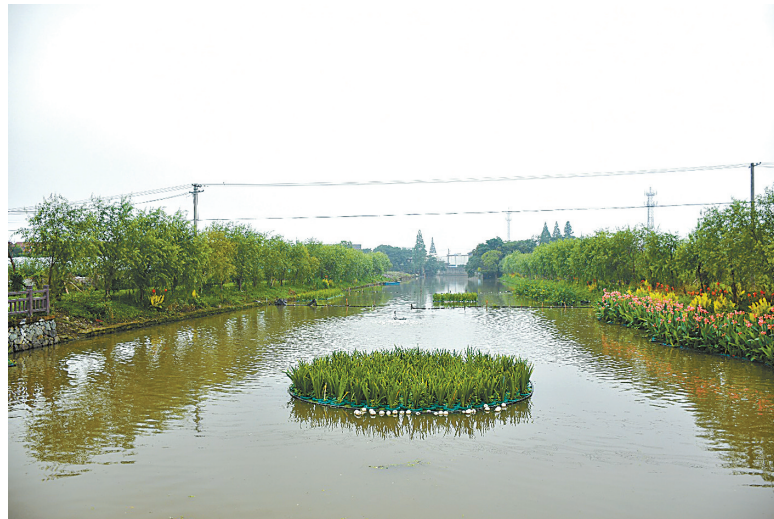
整治后的裘市大河