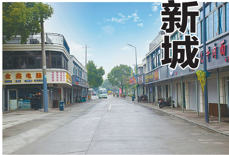
整治后的洪塘老镇街区焕发新活力。