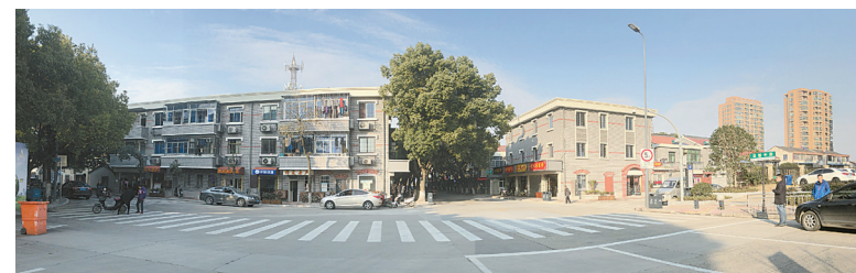
整治前后的洪塘老街对比图