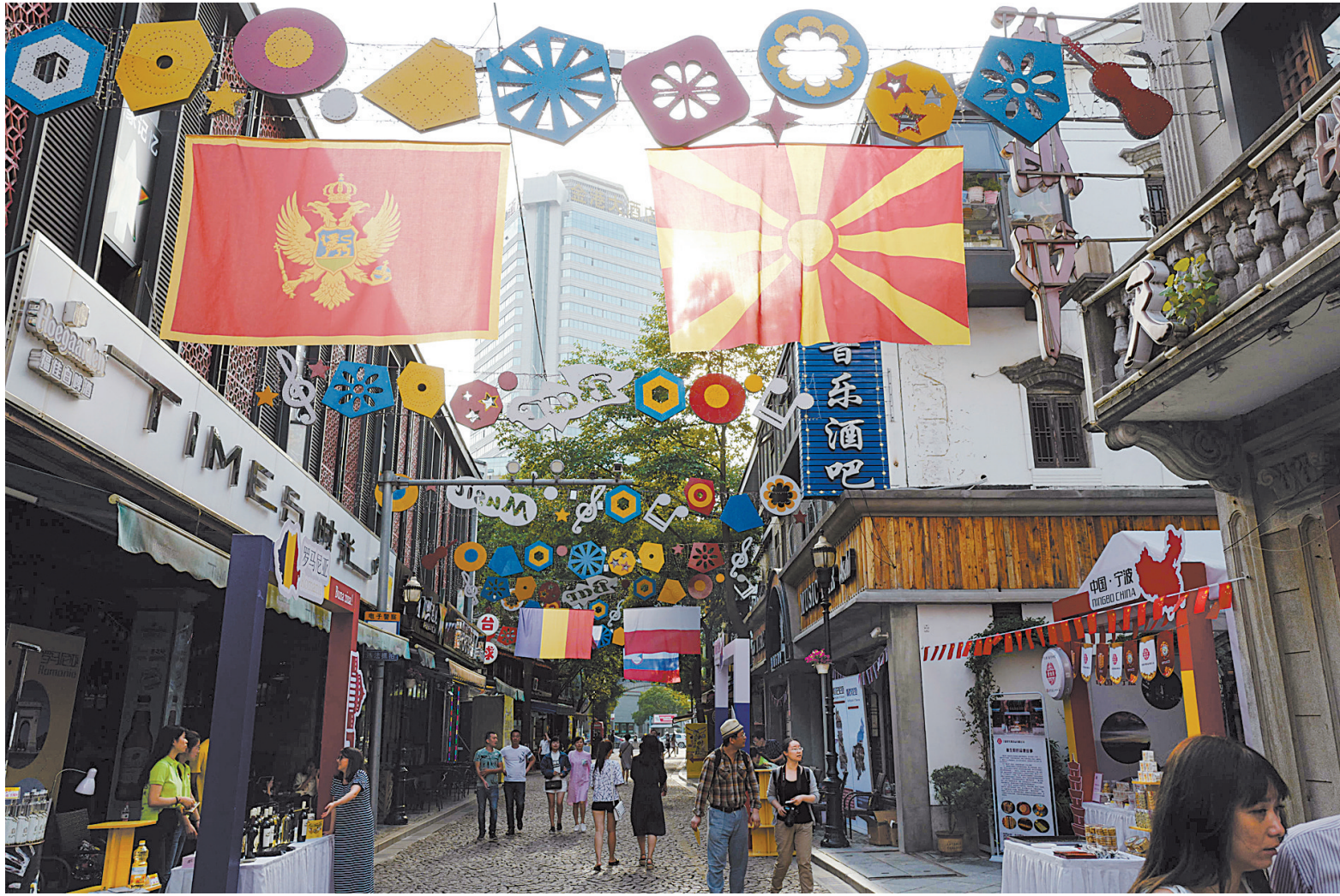
老外滩刮起浓浓的“中东欧风”。