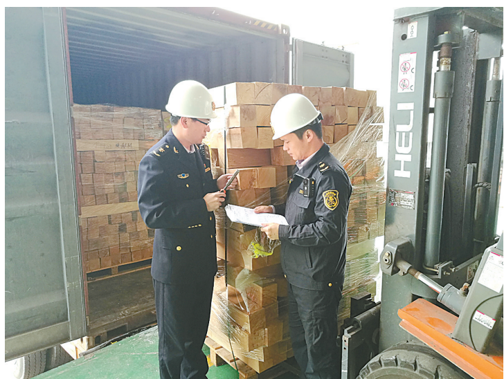
图为检验检疫人员正在查验来自中东欧的进口木材。

上周，宁波航运交易所发布的海上丝绸之路指数之宁波出口集装箱运价指数(NCFI)报收于773.0点，较上一周上涨7.1%。21条航线指数中有17条航线上涨，4条航线下跌。“海上丝绸之路”沿线地区主要港口中，13个港口运价上涨，5个港口运价下跌。