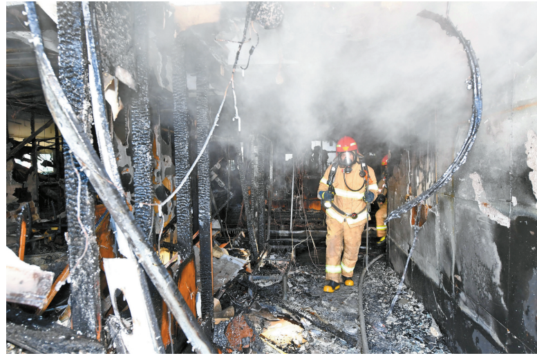
1月26日,在韩国庆尚南道密阳市,消防人员在被烧毁的医院内工作。

韩国媒体报道,世宗医院2008年建立,是一家疗养医院,既有长期治疗的住院病人,也接受普通患者就诊。