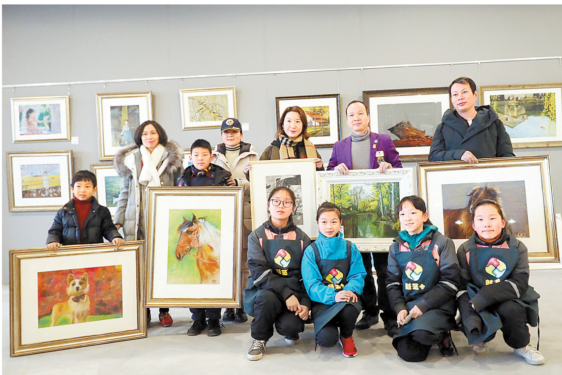
▲商店里出售的画都出自学生之手。

长来购买,并把把这个信息传达到学校的59个班级。校方认为,售卖顺利能给学生成就感;即使售卖不顺利,也能让学生明白做的每件事并不能都成功。