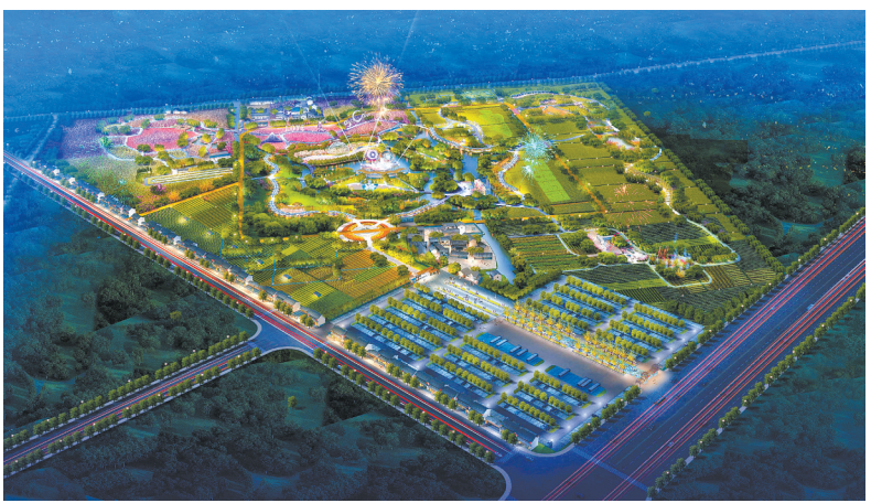
达人村项目效果图(夜晚)

近两年,甬江街道城市化步伐大步前进。社区数量达到9个,数量已经超过了农村。在城市社区建设方面,街道在湖西社区成立街道级社会组织服务平台“邻里益家”,目前,全街道共建成109家社会组织,助推城市社区的社会组织建设。湖西社区被评为“全国社会工作示范基地”,并且荣获市第二届十佳“品质社区”;在安置房社区建设方面,街道通过在朱家社区开展“五色芳邻”文化社团孵化项目,在包家社区成功打造我区第一例农民安置社区自治物业项目,在湾头社区、永红社区建成全市首家社区博物馆和社区非遗文化馆,助推“农民市民化”进程;此外,对于市区首家外来务工人员社区——梅堰社区,街道持续打造“新甬江人志愿者”服务品牌,2016年,该志愿者服务团队被评为“中国好人”。