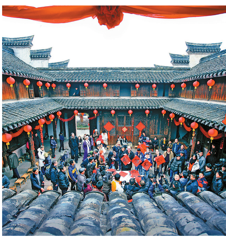
“桃花盛开”农村文明示范线上的萧王庙街道滕头村。