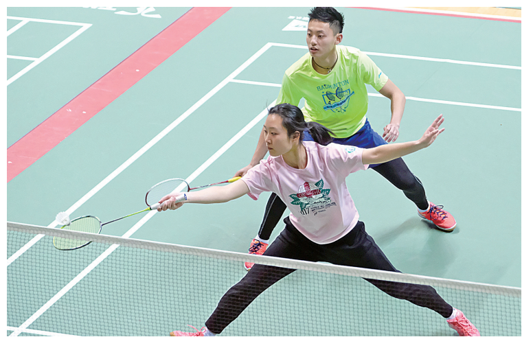
图为省中小学生羽毛球排名赛比赛现场。