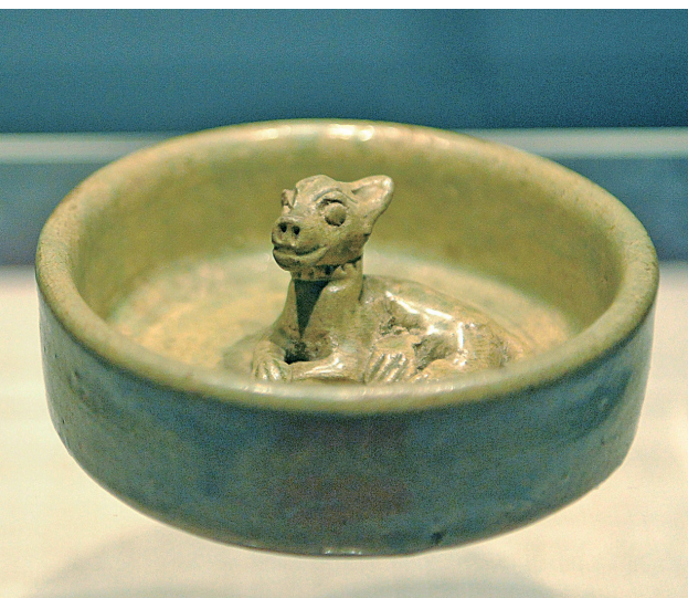
越窑青釉瓷狗圈(西晋)。