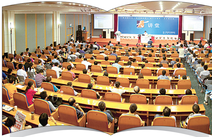
12年来,“天一讲堂”周周有讲座,月月有名家。

今年年底,位于东部新城的市图书馆新馆将投入使用。届时,广大市民将多一个阅读好去处。