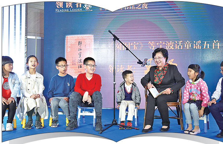
“领读者”活动让孩子们享受到阅读的快乐。