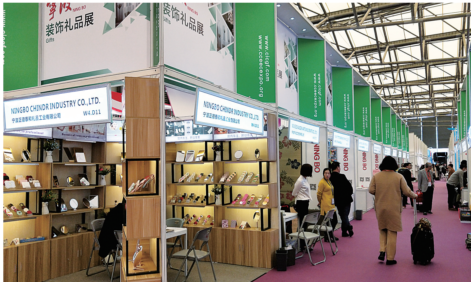
图为华交会宁波展区。