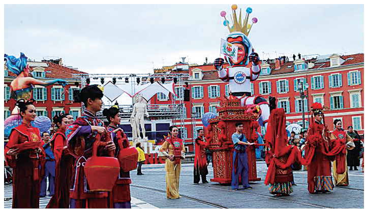
图为宁波在法国尼斯嘉年华活动上展示。

如果说，3月1日只是一场热身，那么3月3日和尼斯嘉年华花车巡游，则成了宁波的“主场秀”。这天晚上，代表团拿出准备了一个多月的“压箱底”节目——《十里红妆》。巡游方阵中，宁波演艺集团演员用漂洋过