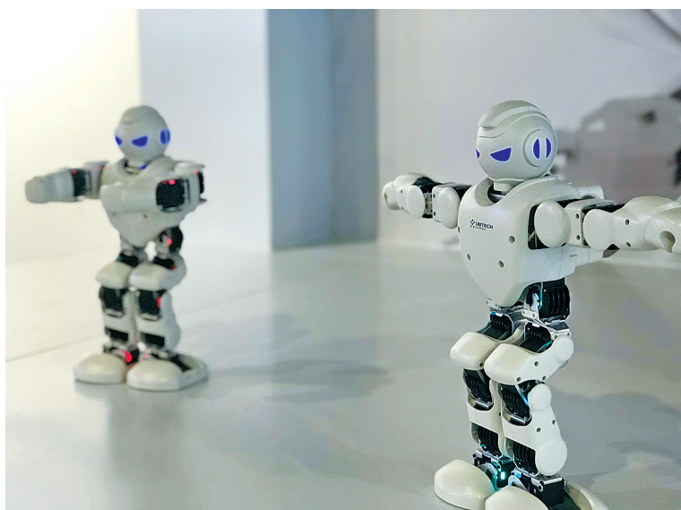
昨天，澳大利亚专家团先后来到美健机器人、讯强电子、中科院自动化研究所北仑人工智能技术中心等企业了解生产经营状况。图为机器人表演吸引了大家的目光。

数据显示，目前吉利控股集团全球拥有员工总数超过8万人，其中外籍人员来自40多个国家，有1.8万余人。“吉利全球化发展也是人才的全球化进程。”安聪慧闻