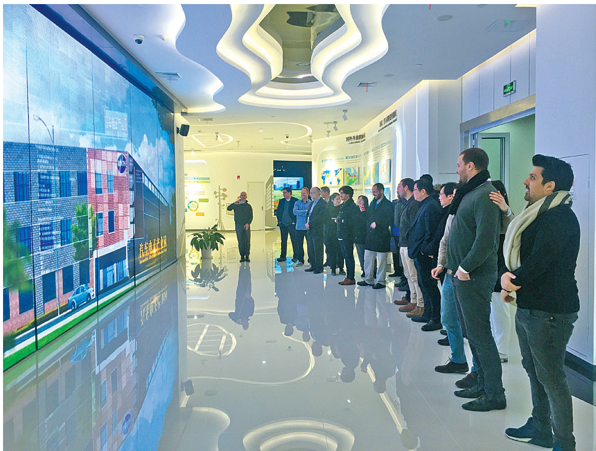
昨天，以色列专家团一行参观了吉利春晚生产基地，并参观了梅山红桥、宁波滨海国际合作学校以及三创基地。在梅山规划展厅，专家团听取了宁波国际海洋生态科技城的规划介绍。

如何跑赢“抢人”大战，吸引优质人才来甬发展，打造一流的创新创业生态体系，助力城市经济社会转型升级，成了社会各界关注的焦点。