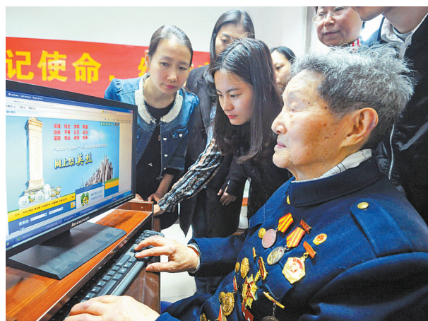
前天,浙江省军区宁波第四离休干部休养所与鄞州东胜街道王家社区联合举行“不忘初心牢记使命”网上祭先烈活动。