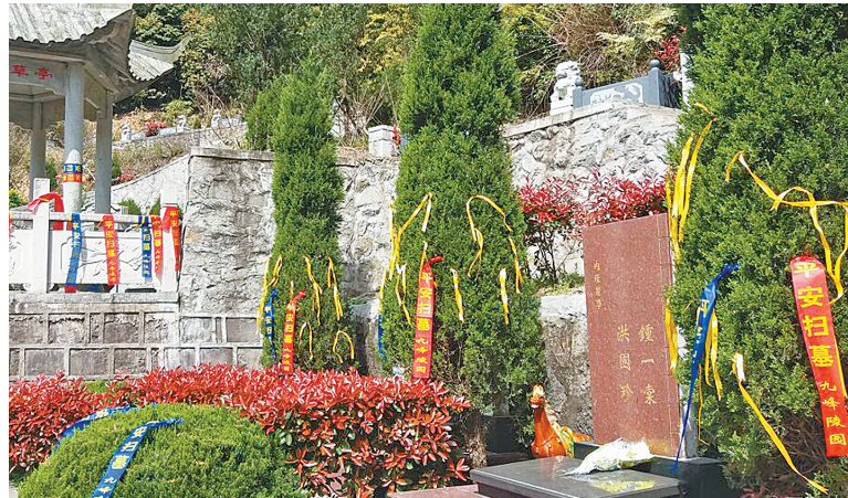
用黄丝带寄托哀思。

文明祭扫在成为新风尚的同时,祭扫的方式也愈发彰显个性。在同泰嘉陵陵园,推出了海葬、雕塑葬等生态葬法;在东吴镇生态墓园,推出了花葬、树葬,每年有100多个穴原有的散坟迁入生态公墓,目前该镇的生态公墓入葬率达到100%。此外,一些互联网公司也推出“网上纪念馆”,为每一位逝者建造一个展示生平微网站,让远在外地的家属用手机扫一扫二维码即可实现网上献花、点香、送水果等服务。