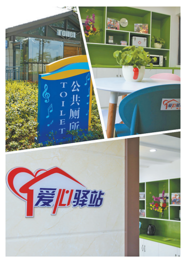
图为宁波大剧院公厕“爱心驿站”。

本报讯(记者王岚 通讯员王佩佩 方伟江)宁波中心城区公厕又有新功能。昨天,甬城第一家挂牌“爱心驿站”的公厕——宁波大剧院公厕闪亮登场。“爱心驿站”紧临公厕主体建筑,有近十平方米。里面窗明几净,三把靠背椅围绕圆桌,依墙设置的橱柜里放置的是生活中常需的热水瓶、茶壶、微波炉、医药箱和针线盒等。而在此之前,这里是公厕的管理用房。